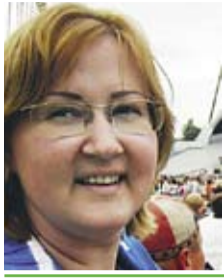
SIRLE BLUMBERG MTÜ Living for Tomorrow

Olen üheksa aastat töötanud seksuaalkasvatuse valdkonnas. Töenäoliselt ei ole see pikk ega lühike aeg, et olla kõigega päris kursis, kuid samas piisav, et võtta endale julgus öelda, mis on jäänud meeli vaevama.